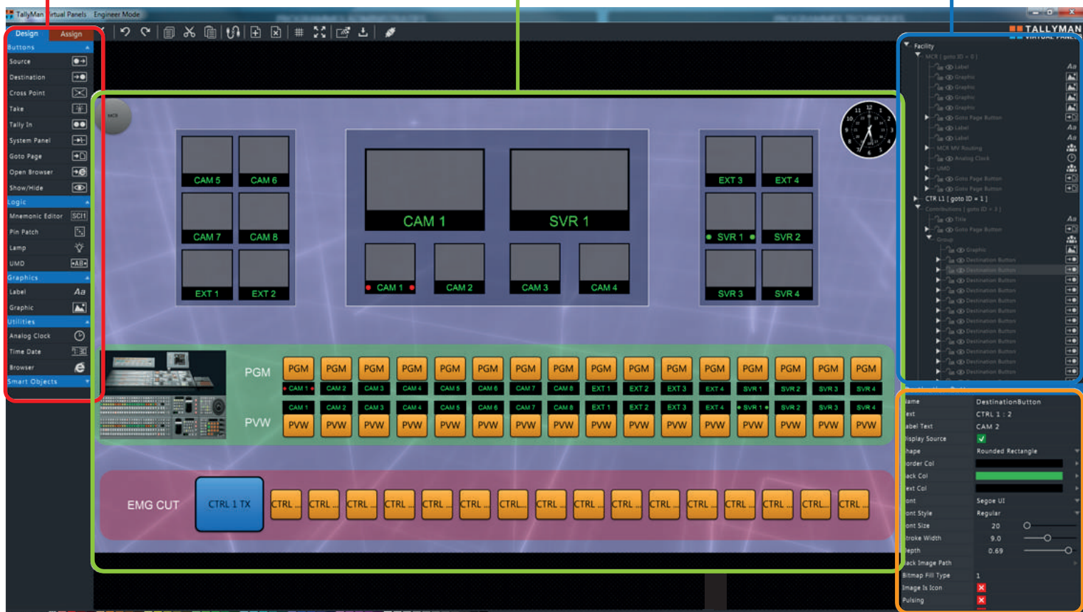
Module de création des interfaces utilisateurs