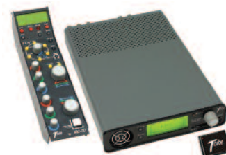
KIWI CO 100